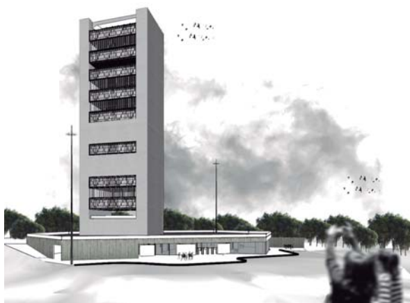
A nova sede do MAC, IEA e NEV terá área construída de 21 mil metros quadrados

A paisagem da Cidade Universitária “Armando de Salles Oliveira”, em São Paulo, ganhará novos contornos. Está prevista a construção de três novos prédios, com projetos de autoria de renomados e inovadores arquitetos brasileiros