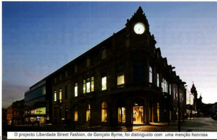
O projecto Liberdade Street Fashion, de Gonçalo Byrne, foi distinguido com uma menção honrosa

A "Casa da Quinta de Vilar", localizada em Penafiel e que utilizou Kerlite 1x3m na remodelação e reconcepção da habitação de pedra e na sua implantação no espaço rural, foi o projecto vencedor. Segundo a memória descritiva do projecto a que o Construir teve acesso, a habitação insere-se numa quinta privada rodeado de carvalhos, pinheiros, e castanheiros, e o local de implantação é caracterizado pela construção tradicional de muros de suporte em granito, utilizados outrora para a definição